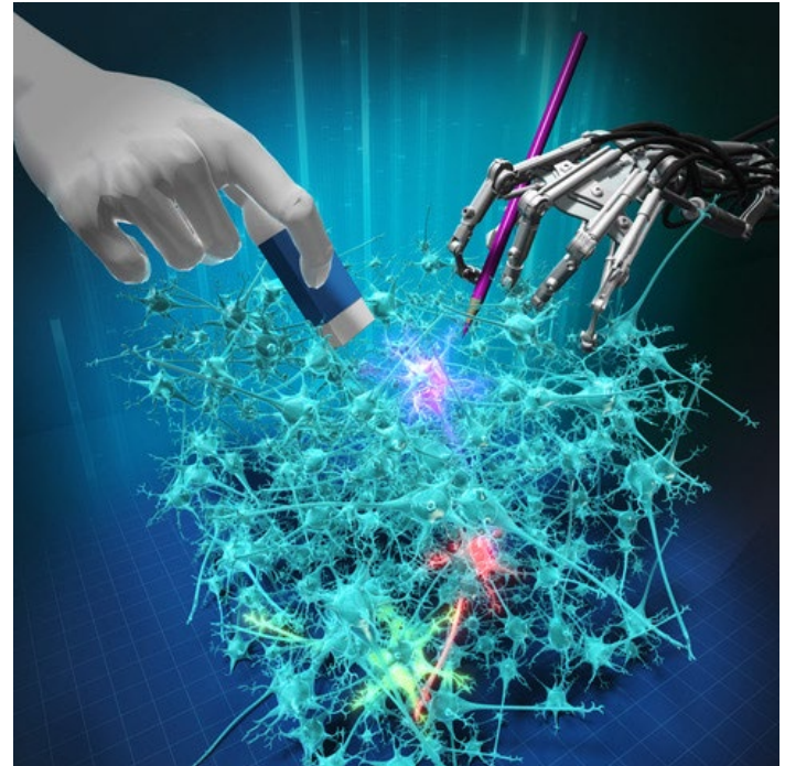
図2：Seg2Link を用いた AI と研究者の共同作業による三次元画像解析のイメージ図