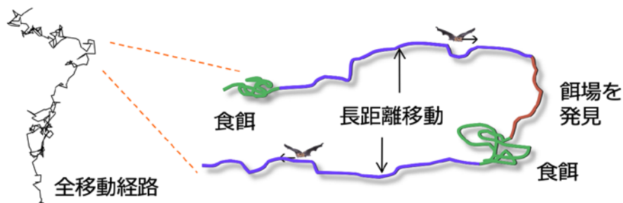
図1：動物行動のデータからの行動状態の推定。

行動のデータからその時の動物の状態（休息/食餌/移動、など）を推定する手法（図1）はこれまで