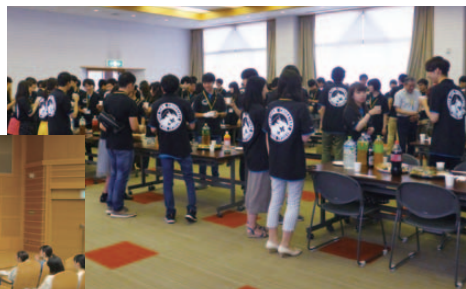
各自の目標に向かって活動だ!