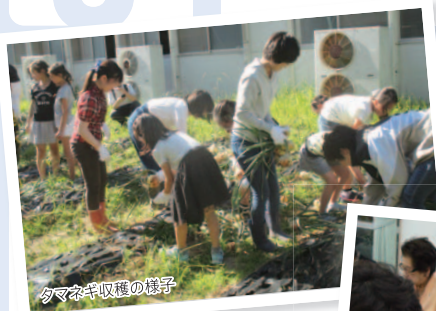
タマネギ収穫の様子