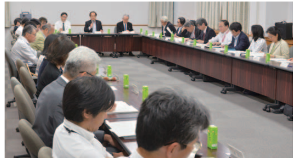
第1回 開学70周年記念事業準備委員会の様子

今後、本学関係者だけでなく、市民や地域、連携する機関・団体、国内外の協定校等学外にも開かれた、さまざまな記念事業の実施に向けて、取り組みを進めてまいります。