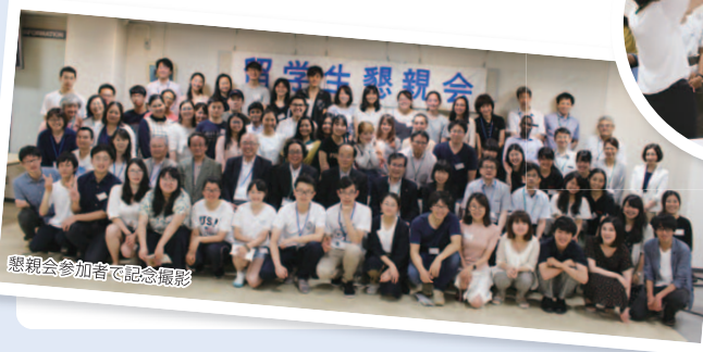
懇親会参加者で記念撮影