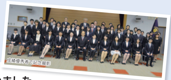
成績優秀者で記念撮影