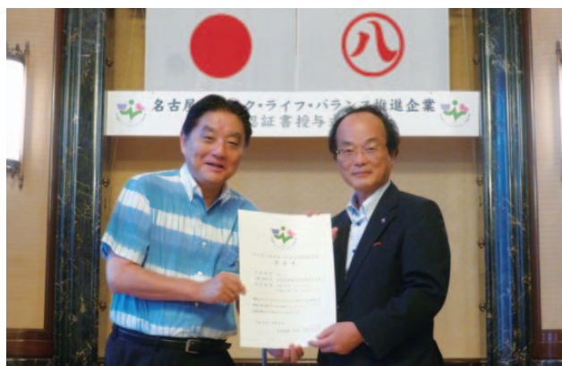
名古屋市 河村たかし市長(左)、本学 郡健二郎学長(右)

2018年7月10日(火)、本学が名古屋市ワーク・ライフ・バランス推進企業に認証されました。本学では、これまで、次世代育成支援などワーク・ライフ・バランスの取り組みを進めてきていますが、一方で長時間労働の問題など、課題も山積しています。今回の認証を励みとして、今後も価値観やライフスタイル等の多様性を受容した、さまざまなワーク・ライフ・バランス施策を展開していきます。