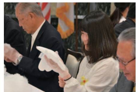
キワニスドール作成の様子