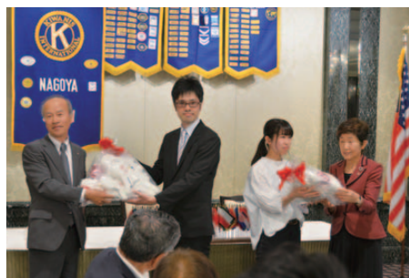
キワニスドール贈呈の様子

2018年6月1日(金)、育成保健看護学ゼミの4年生8名が、名古屋キワニスクラブの「キワニスドールを作る会」に参加し、ドールの作成体験ならびにドールの寄贈を受けました。キワニスドールは、病気の子どもたちに対する治療の説明の際に用いられ、子どもたちを励ましたり、小児医療の現場において活躍している人形です。今回寄贈を受けた人形も、子どもたちへの支援を考えるツールとして、引き続き授業や実習において活用されます。