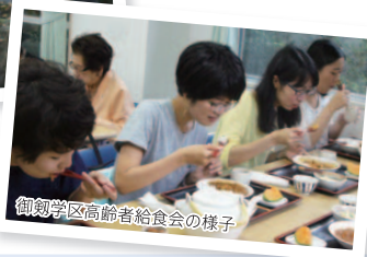
御剣学区高齢者給食会の様子