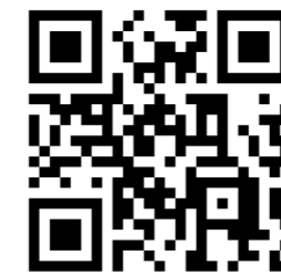
研究室ウェブサイト

最後に、筆者が大学教員になって5年目に「人づくり」のシンポジウムでお話させていただいた時の報告をご紹介します（QRコード）。この10年間で社会状況は変わりましたが、目指すところはブレていないと思います。出遅れた駆け出し教員の気負いがあって少々恥ずかしいところもありますが、これを、公衆衛生やグローバルヘルスを学びたい・学んでいる若いみなさんへのメッセージのかわりしたいと思います。