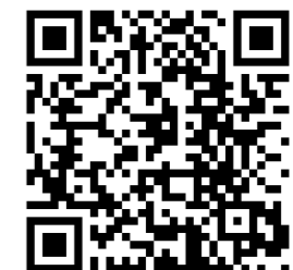
シンポジウム報告