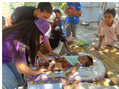
写真1 東ティモールにおける母子栄養の社会的要因プロジェクトのフィールド調査

基本的な統計を適切に使えるようになること、成果を英語で発信すること、アカデミアにとどまらない国内外のネットワークを持って視野を広げることを大学院生指導の基本としています。また、海外でも国内でもフィールド調査を基本としていますので、特に博士後期課程では、環境適応力、交渉・調整力、チームマネジメント力を付けることも重要と考えています。研究成果は、できるかぎり国際学会と国際誌で発表するようにしており、博士前期、後期課程とも在学中に1回は国際学会発表をすることが定着しつつあります。大学院生の半数以上が英語で論文を書いています。一方、地域での発信、現場の関係者との連携にも力を入れています。